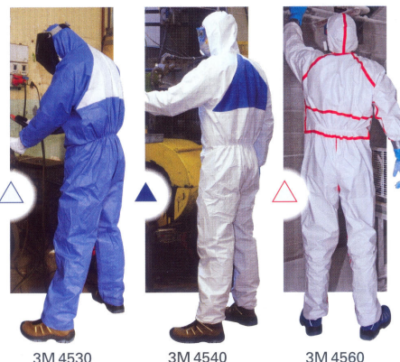
3M 4530 3M 4540 3M 4560 3M™ 4530 Ochranný oděv 3M™ 4540 Ochranný oděv 3M™ 4560 Ochranný oděv

Ochranné oděvy 3M™ 4530 a 3M™ 4540 jsou klasifikovány jako Typ 5/6 (protiprachový a odolný proti postříkání), zatímco ochranný oděv 3M™ 4560 splňuje také požadavky na Typ 4 (ochrana proti vodní nebo olejové mlze).