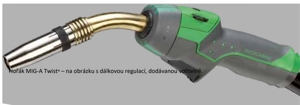
Hořák MIG-A Twist® – na obrázku s dálkovou regulací, dodávanou volitelně.

MIG-A Twist® se dodává v různých délkách a s různými krky. Lze jej konfigurovat s různými dálkovými regulacemi pro nastavení svařovacího proudu z rukojeti hořáku. Dálkové regulace lze snadno vyměňovat podle potřeby bez použití nástrojů.