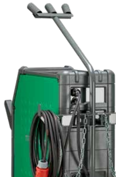
Držák kabelů pro